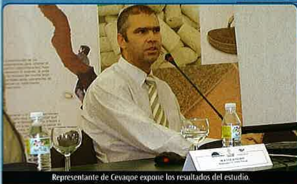
Representante de Cevaque expone los resultados del estudio.

E n este trabajo abordamos las desviaciones organolépticas atribuidas al tapón de corcho, y en particular el control y el dominio de los cloroanisoles en el sector corchero.